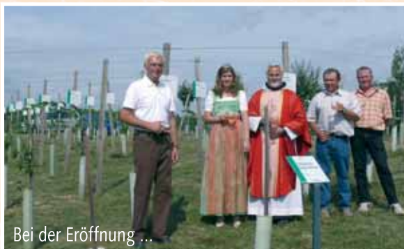
Bei der Eröffnung ...